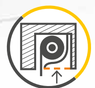
WARTUNG VOM RAUMINNEREN AUS