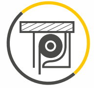
ROLLADENKASTEN OHNE EINBAU