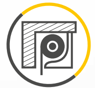
ROLLADENKASTEN EINSEITIGER EINBAU (VON AUSSEN)