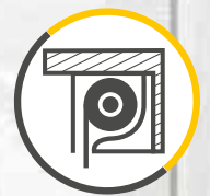
ROLLADENKASTEN EINSEITIGER EINBAU (VON INNEN)