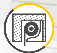
ROLLADENKASTEN BEIDSEITIGER EINBAU